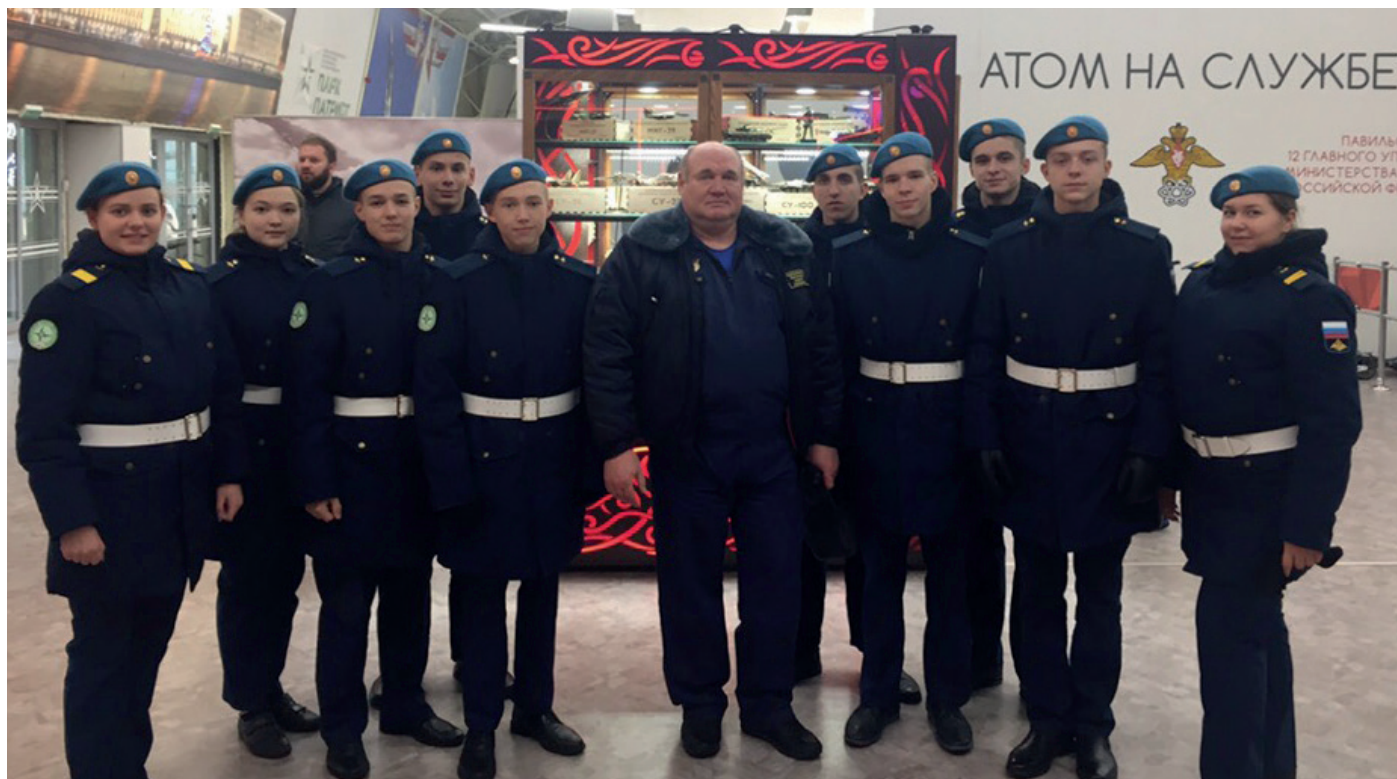
Команда военно-патриотического воспитания «Полёт», 2018 г, Москва